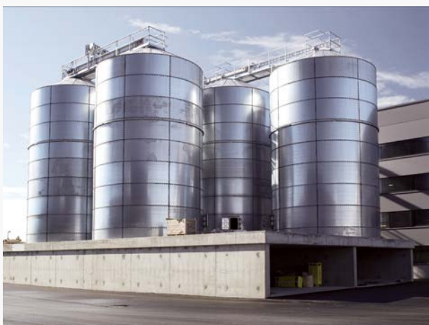
Silo de armazenamento