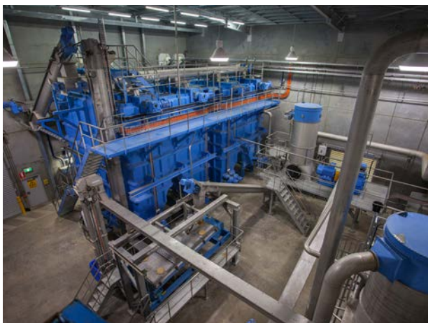
Tolvas de farinha